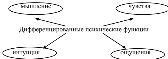
Рис. 2. Дифференцированные психические функции по Юнгу.

В связи с тем, что сильная функция находится в сознании, она имеет преимущественное значение. По Юнгу, контролируется сознанием лишь сильная (дифференцированная) психическая функция. Вся теория Юнга построена на противоположных тенденциях и компенсирующих эффектах. Юнг утверждает, что это спасает психику человека.